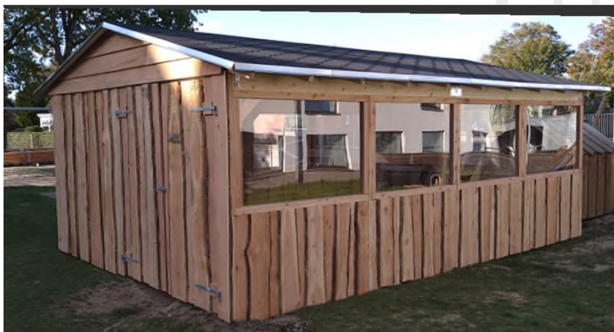
Foto af bålhytten

Beliggenheden fremgår af nedenstående oversigtskort.